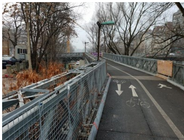
Provisorische Fuß- und Radwegbrücke Blickrichtung Süden