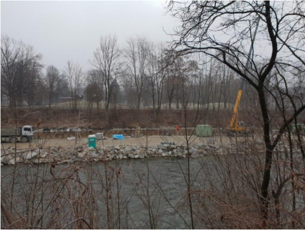
Baustelle ZSK im Bereich der zukünftigen Augartenbucht Blickrichtung Osten vom rechten Murofer