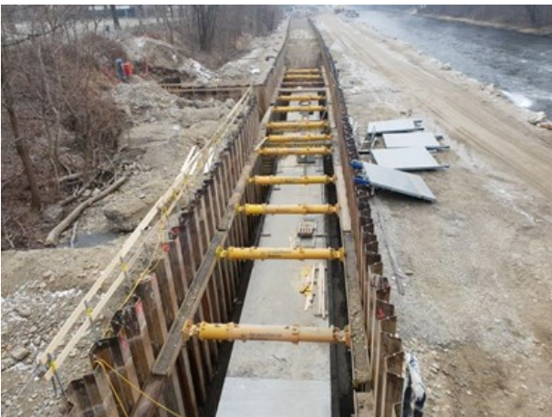
Fertiggestellter ZSK im Vordergrund, Wiederverfüllung der Kanaltrasse im Hintergrund Blickrichtung Süden vom Augartensteg