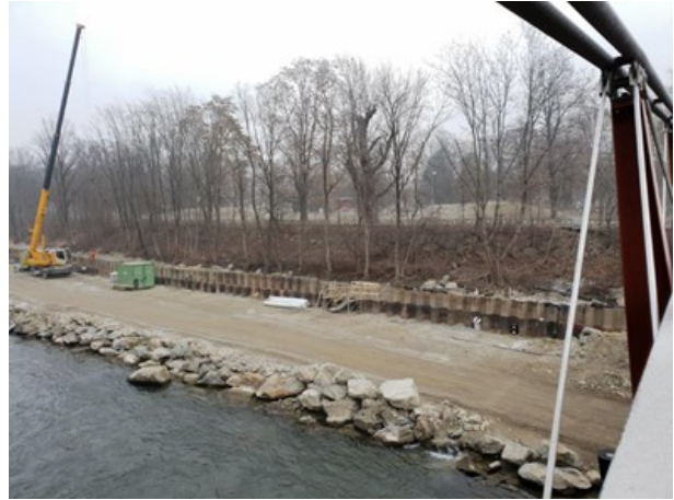
Baustelle ZSK im Bereich der zukünftigen Augartenbucht Blickrichtung Nordost vom Augartensteg