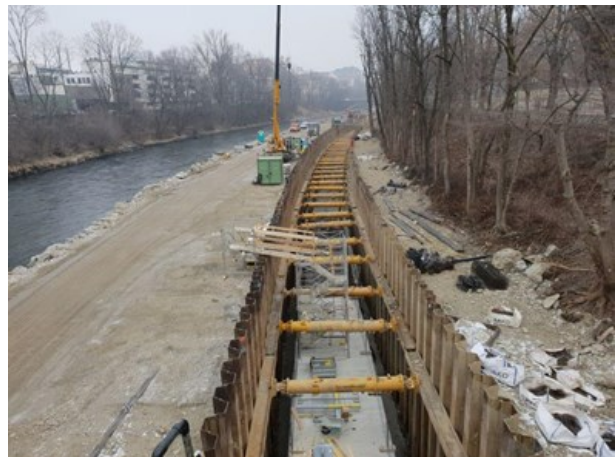
Bereits teilweise fertiggestellter ZSK im Bereich der zukünftigen Augartenbucht Blickrichtung Norden vom Augartensteg

Abbildungen 1: ZSK-Baustelle Bereich Augarten, Stand 31.1.2019