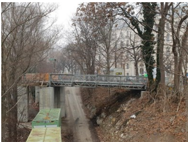
Provisorische Fuß- und Radwegbrücke und Baustellenstraße Blickrichtung Norden von der Radetzkybrücke